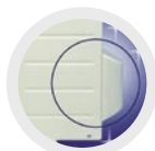
OCHRONNA POKRYWA ZAWORÓW