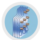
HYDROFILNE ŻEBERKA ALUMINIOWE